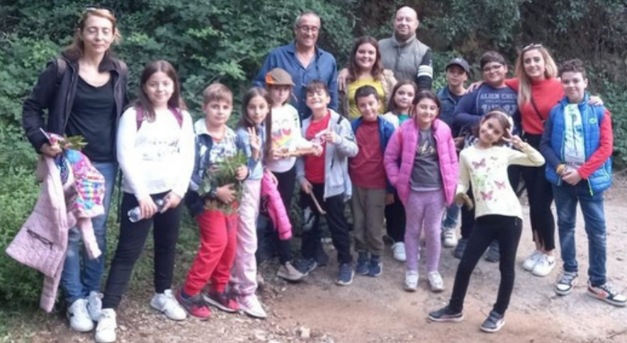
Trekking e biodiversità: visita guidata al bosco di Pillaro