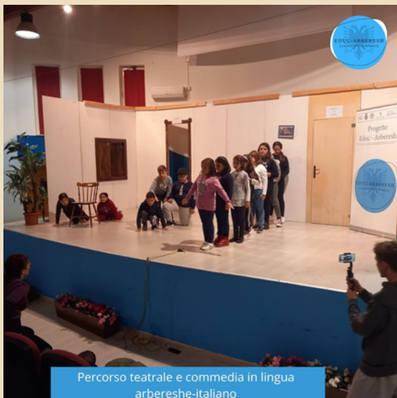
Percorso teatrale e commedia in lingua arbereshe-italiano

L'attività teatrale, sia in forma di laboratorio attivo, sia in forma di visione partecipativa, risponde ai bisogni urgenti che bambini e ragazzi si sono trovati ad affrontare nelle diverse situazioni che la società contemporanea gli impone di affrontare quotidianamente.