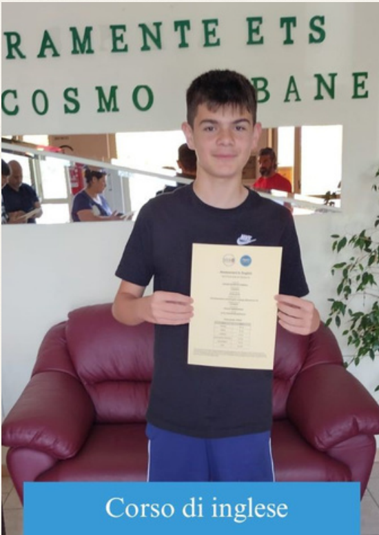
Corso di inglese