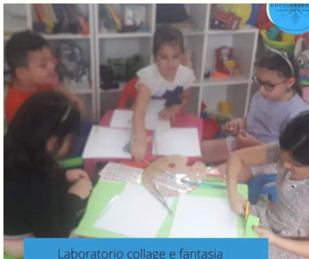
Laboratorio collage e fantasia