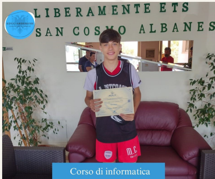
Corso di informatica

Hanno avuto inoltre la possibilità di conseguire l'esame per la patente europea del Pc (ECDL) presso un ente di formazione convenzionato.