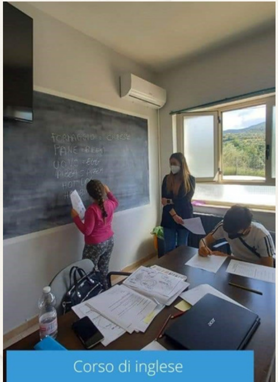
Corso di inglese