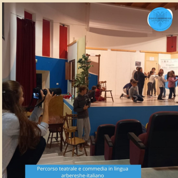
Percorso teatrale e commedia in lingua arbereshe-italiano

Alla fine del corso è stata rappresentata una commedia in lingua arbereshe-italiano sulla leggenda tramandata da generazione in generazione, di Costantino e Jurendina, due esponenti che rappresentavano il popolo arberesh.