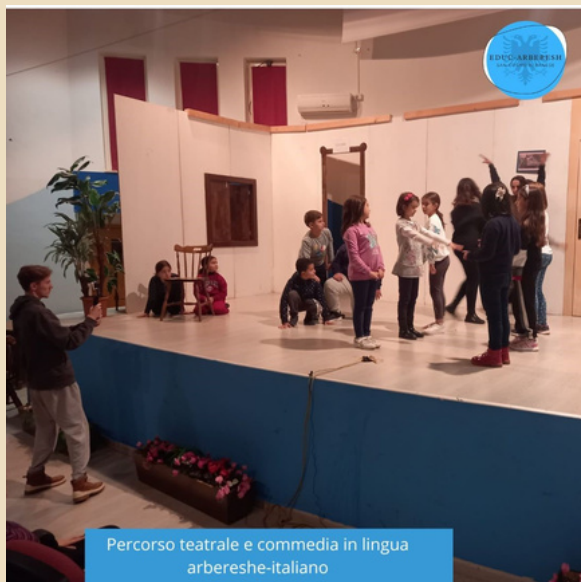
Percorso teatrale e commedia in lingua arbereshe-italiano