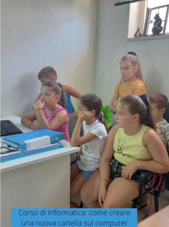
Corso di informatica: come creare una nuova cartella sul computer

Hanno avuto inoltre la possibilità di conseguire l'esame per la patente europea del Pc (ECDL) presso un ente di formazione convenzionato.