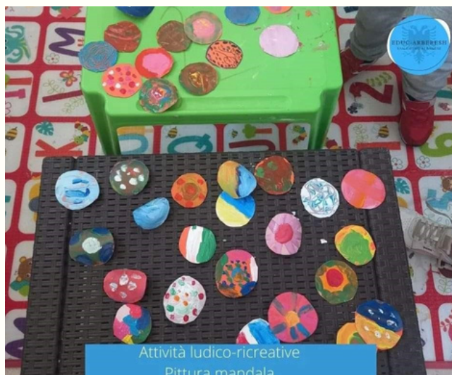
Attività ludico-ricreative Pittura mandala