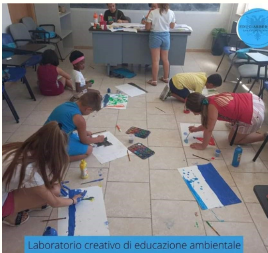
Laboratorio creativo di educazione ambientale

E' stato possibile integrare l'aspetto didattico delle discipline con un approccio ludico, che ha consentito di vivacizzare l'apprendimento sviluppando abilità costruttive ed atteggiamenti positivi verso nuove tematiche di studio e verso la riscoperta artistica e culturale del proprio territorio di appartenenza.